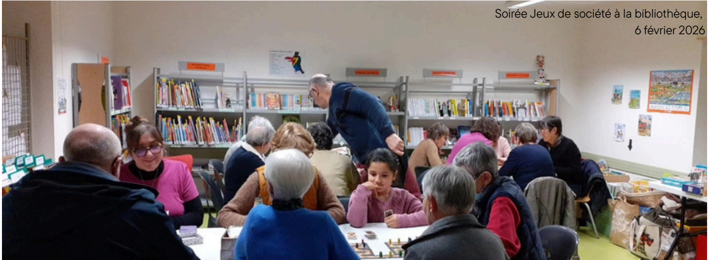
Soirée Jeux de société à la bibliothèque, 6 février 2026